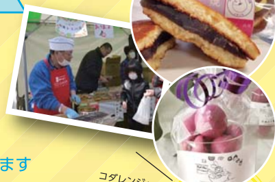
コダレンジャーの イベントも開催!

参加店舗: 青柳、玉川屋、自然菓子 cacika、ヴェルデ 小平第二みどり作業所 洋菓子サントノール、株式会社 NMC 協力: 小平市商工会