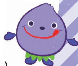
▲小平市の マスコットキャラクター ぶるべー