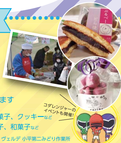
コダレンジャーの イベントも開催!

参加店舗: 青柳、玉川屋、自然菓子 cacika、ヴェルデ 小平第二みどり作業所 洋菓子サントノール、株式会社 NMC 協力: 小平市商工会