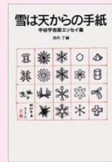
右：ゾウの時間ネズミの時間/本川達雄 著 (中公新書) 左：雪は天からの手紙/池内了 著 (岩波書店)

科学に詳しくない人にもわかりやすく自然の営みや世界のしくみを伝える、科学者が書いたエッセイや一般書、絵本を揃えました。寺田寅彦や中谷宇吉郎など、名著と呼ばれる文章に触れてみませんか。