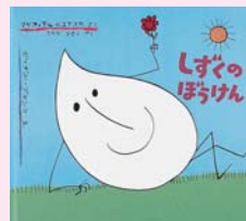
しずくのぼうけん マリア・テルリコフスカ 作/ ボフダン・ブテンコ 絵/他 (福音館書店)

絵とストーリーを通じて子どもたちの科学の目を育てる科学絵本。科学の本の読み聞かせの会「ほんとはんと」がセレクトした科学絵本100冊から、ピックアップして紹介します。