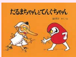
だるまちゃんどてんぐちゃん 加古里子 作/絵 (福音館書店)

科学を研究する・教える道に進んだ人たちを、科学の道に導いた本はどんな本だったのか。それぞれの「私の一冊」への思いを、本とともに紹介します。