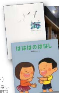
上：海/下：ははのはなし 加古里子 作/絵 (福音館書店)

(選んだ本は各市の図書館でも紹介します ※各市1館。どの図書館で行うかはお問い合わせください)