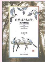
自然はともだち 吉良幸世 著 (自由学園出版局)