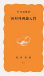
相対性理論入門 内山龍雄 著 (岩波書店)