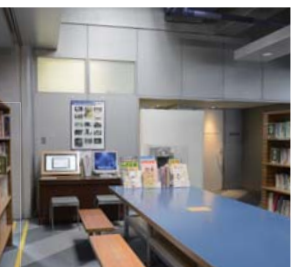
多摩六都科学館 図書コーナー ※貸出しはしていません