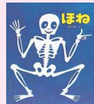
ほね 堀内誠一 作 (福音館書店)