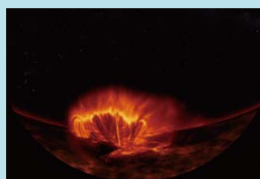
バーチャル太陽系旅行