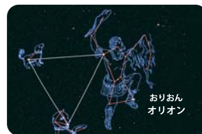
3 星の説明を聞きます