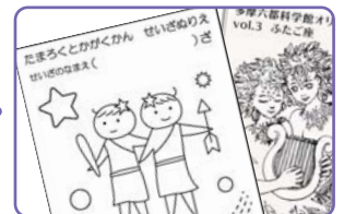
4 星座のぬりえがもらえます