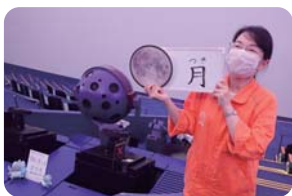
1 星や月のクイズをします