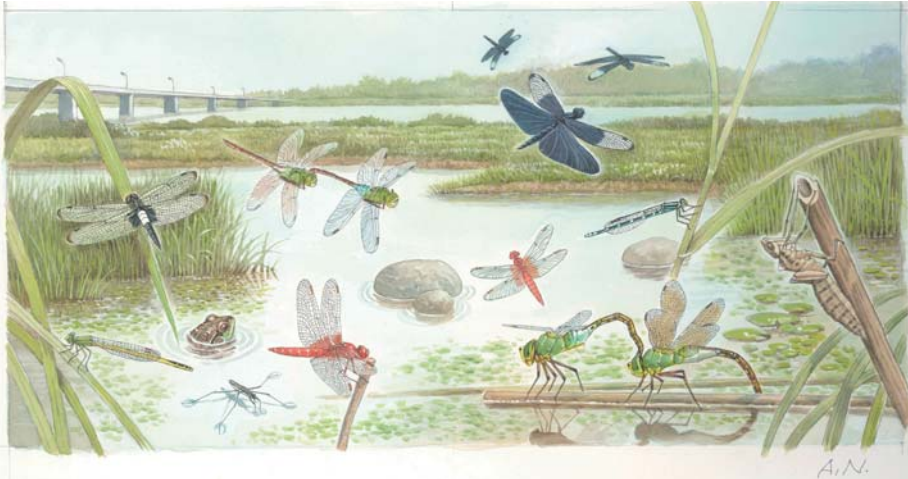
▲旺文社「昆虫ナビずかん4ギンヤンマナビ」原画