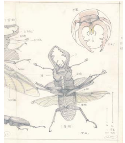
▲BL出版／はじめてのずかんえほん ビッグチャム「かぶとむしくわがたむし」下絵