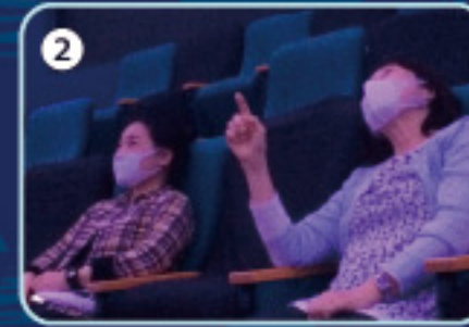
2 みんなでほしを見ます