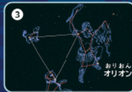
3 ほしのはなしを聞きます