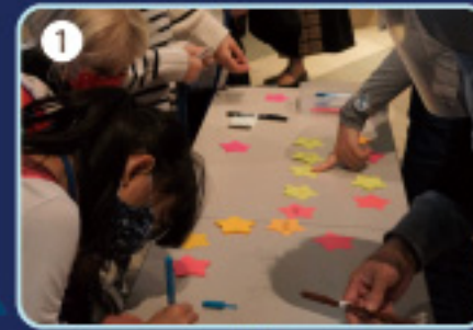
1 いろいろな言葉で“ほし”と かいてみます

🕒 とき 17:30 ~ 18:30 📍 ところ たまろくとかがくかん さいえんすえっく 多摩六都科学館 サイエンスエッグ 💰 おかね 無料 (かかりません) 👤 参加できるひと しょうがく ねんせい ちゅうがくせい おとな いっしょ さんか 小学1年生から中学生 (大人と一緒に参加してください) こうこうせい いじょう おとな 高校生以上の大人 ※ それ以外の人は参加できません 👥 参加できる人数 さんか にんずう 80人 (抽選)