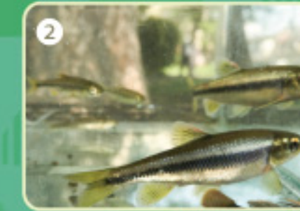
2 いきものを観察します