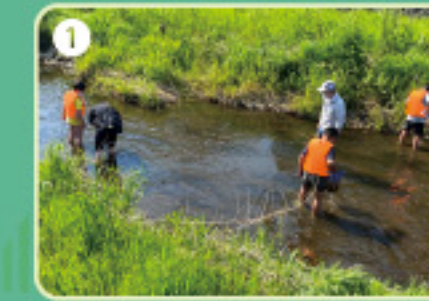
1 川に入って いきものを さがします

🕒 とき 13:00 ~ 15:00 📍 ところ ひがしくるめし こやま こうえん ちか くらめがわ 東久留米市小山れんげ公園の近くの黒目川 あつ ぼしょ ひがしくるめえき あめ ふ ちゅうし (集まる場所は東久留米駅です 雨が降ったら中止です) 💰 おかね 無料 (かかりません) 👤 参加できるひと しょうがく ねんせい ちゅうがくせい おとな いっしょ さんか 小学1年生から中学生 (大人と一緒に参加してください) ※ それ以外の人は参加できません 👥 参加できる人数 さんか にんずう 10組 (抽選) ※ 1組は子どもと大人が1人ずつ