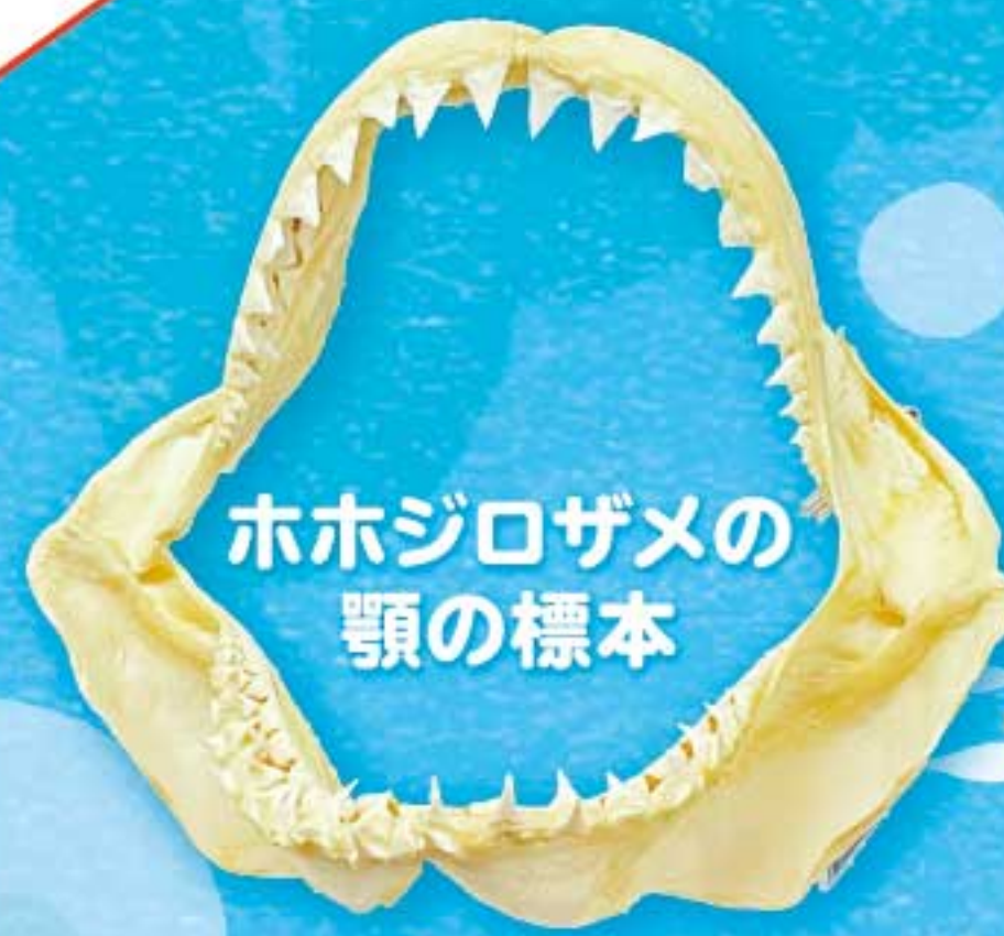
ホホジロザメの顎の標本