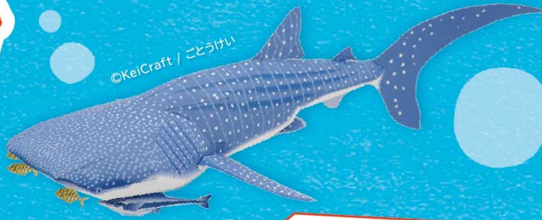
ジンベエザメのペーパークラフト

魚は生き物の中で初めて顎を持った生き物といわれています。その魚たちは食べるためにどんな口の進化をしたのでしょうか？ 生体や標本を通して個性豊かな魚たちの色々な口を見比べてみましょう！